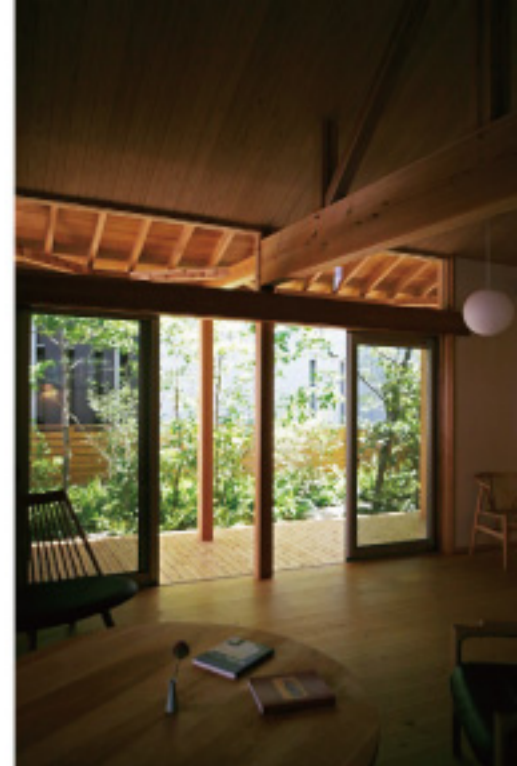
夏の日差しを遮る軒