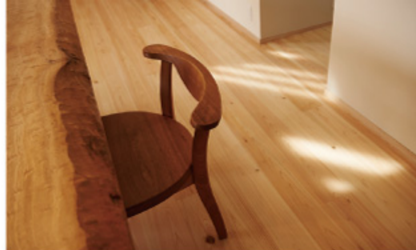
冬の日差しは部屋の奥まで届ける